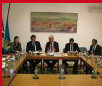
DELEGACIJA HOLDINA ITTIFAK U TUZLANSKOM KANTONU