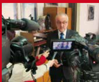
TUZLANSKI KANTON - VAŠ POSLOVNI PARTNER