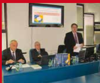
UNAPRJEĐENJE PROIZVODNJE PRIMJENOM REINŽENJERINGA