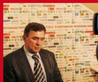
IZVOZNI PROJEKAT - 50 NOVIH RADNIH MJESTA